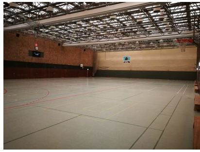
Dreifachhalle im Sportpark Nord